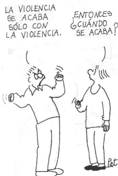
Pat Carra. Bombas de risa . 2001