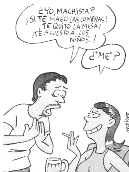
Maitena. Instituto Andaluz de la Mujer