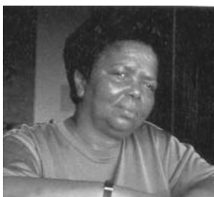
Cesárea Évora. Cantante de Cabo Verde