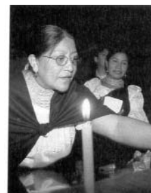
Nina Pacarí. Diputada de Ecuador

Una vez contestadas, cada alumno /a leerá en voz alta la respuesta a cada foto. Después, el/la profesor/a les dirá quién es en realidad esa persona y a qué se dedica. Una vez analizadas todas las fotos el/la profesor/a preguntará a la clase: